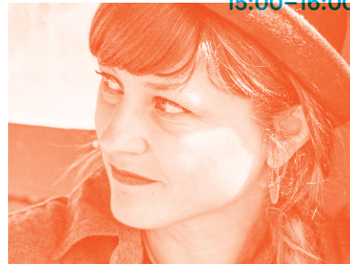
Foto: Dita Zipfel © Dawn Stoffer, Stefanie Höfler © Christina Neidenbach

Eintritt: 6/4 € Tageskasse: +1 € Kooperationspartner: Junges Theater Freiburg